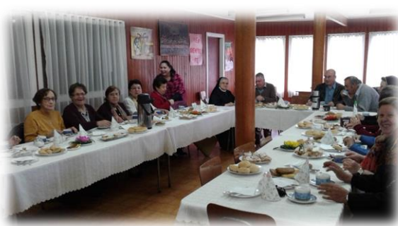
MISIONARI MILOSRDA – CILE

◆ Promičeš li u pastoralnom služenju tvoje zajednice ulogu laika?